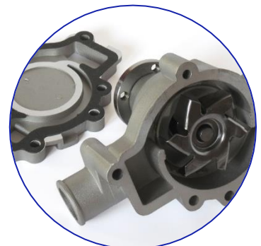
Bombas y compresores