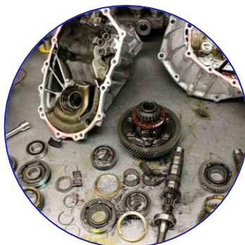
Cajas de cambio