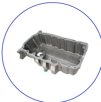
Carter de aceite