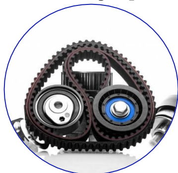
Caucho, cuero y tela