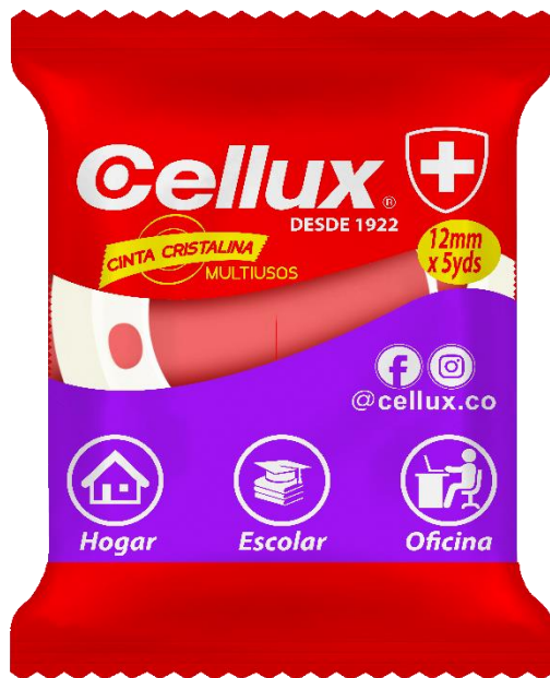
C-102 Cinta de oficina cristalina