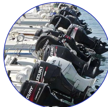
Botes y lanchas