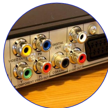
Conexiones de audio y video