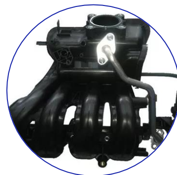
Múltiple de admisión / escape