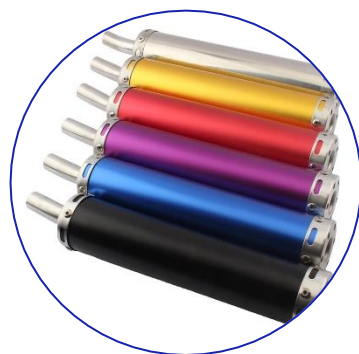
Tubos de escape