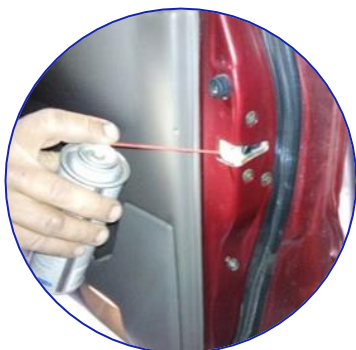
Puertas y bisagras