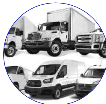
Carros, camiones y camionetas